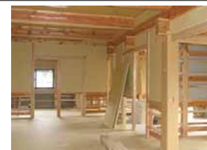
H19年3月上旬～、間仕切り