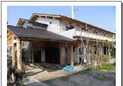
H19年3月中旬 2階ベランダ手すりに着工