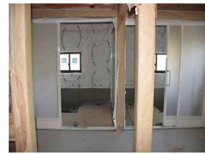
H19年3月中旬の風呂場