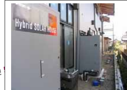
H19年3月下旬 ソーラーシステム完成