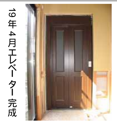
19年4月エレベーター完成