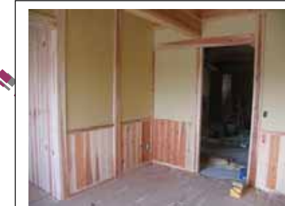
H19年4月上旬 腰壁がついて 寒用気が早えてきた