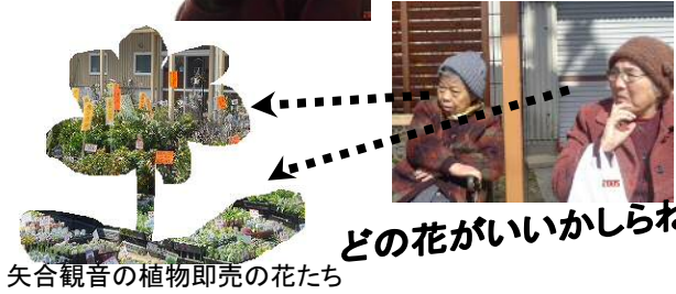
矢合観音の植物即売の花たち