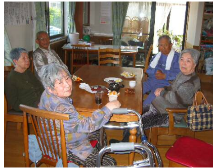
3時のおやつに柏餅。「おいしかったね☆☆」