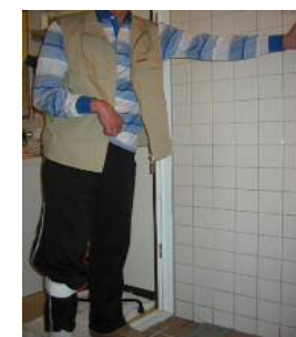
入口の手すりに掴まる