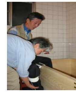
もう片方も・・・