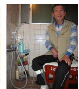
清酒箱に腰掛ける