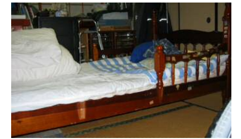
ついでにお披露目。二段ベッドの改造品！手すりもあっていい感じ。

そうそう、つい先日、念願の床屋へ行ってきました。倒れた時に手術のためにと坊主にしてから徐々に伸び、退院時にはボサボサだったお父ちゃんの髪の毛。外出に対しては、トイレの事を心配しなかなか行動に移せませんでした。娘の(何の根拠もない)「私がなんとかするから行くよ!!」の言葉に納得し、人も車も少なくなった時間帯に車イスひいて行きました。本当は歩行器使ったのんびり歩いて行こうかとも考えたけど、床屋さんの都合もあり今回は断念。でも、店内に入るまでの階段やイスに座るまでは歩行器使って歩けなく・・・。「これが生活リハビリだあ〜」と、自分で動いてもらいました。すごく緊張したと思うけど、髪形もスッキリしてちょっぴり男前になり上機嫌なお父ちゃんでした。