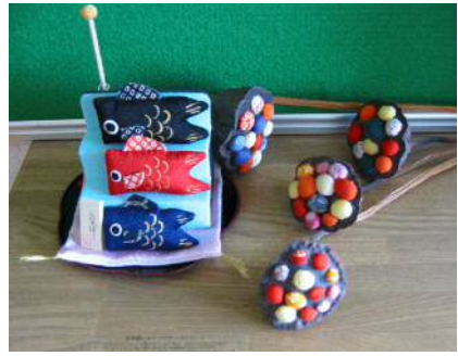
玄関で泳いでた“こいのぼり”

有料職業紹介 つしま紹介所 (0567) 26-1281 訪問介護 ナイス・ケア (0567) 26-3699 通所介護 ナイス・デイ (0567) 26-1282 宅老&託児 ナイス・ホーム (0567) 26-1282 E-mail s_o_s@clovernet.ne.jp (有)サポート・ワン・サービス 〒496-0036 愛知県津島市愛宕町4-113 代表TEL: 0567-26-3921/FAX: 0567-26-3922