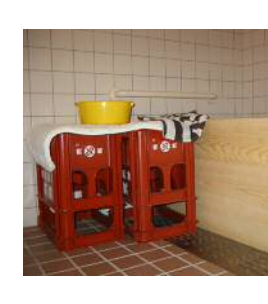
ちょうど良い高さの