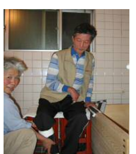
さあ、片足ずつ・・・