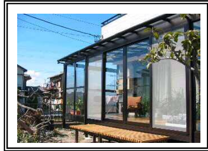
デイ1階の庭に作りました。