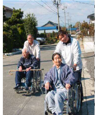
暖かい日は一緒に 外出しませんか?