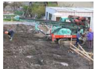
18年11月 柱状改良(何箇所も地下4mまで穴を掘りコンクリを流し込んで地盤改良)