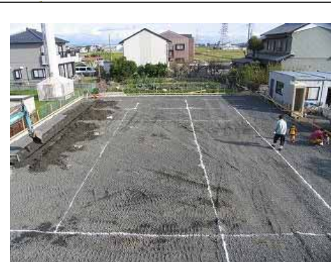
18年11月末 基礎工事開始