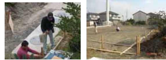
18年11月 丁張り(ちょうはり) 切土や盛土をするとき、施工の基準位置などを示す板などの目印作り