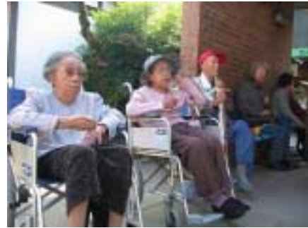
到着後、まずは草もちで一服