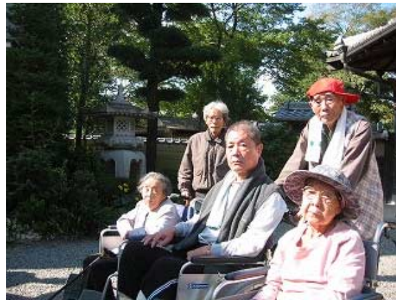
今日は、あまり外出されない方も一緒に出掛けられたので記念に1枚

一年の中でも今って お出掛けしやすい時期ですね。 この日は、稲沢市の矢合観音さん へお出掛けしてきました。 天気の良い日、「今日はどこ行く？」 という会話がしょっちゅう 飛び交っています！