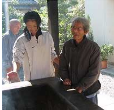
「病氣しないように・・・」とお線香の煙を身体にかけて・・・