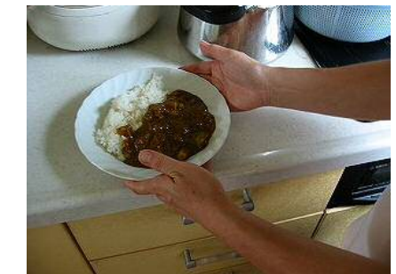
栄養たっぷり高菜カレー