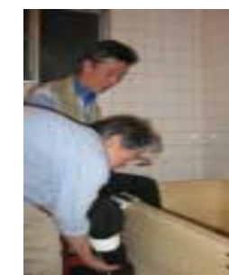
もう片方も・・・