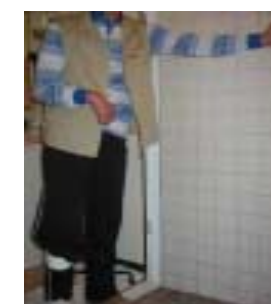
入口の手すりに掴まる