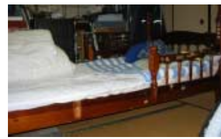
ついでにお披露目。二段ベッドの改造品！手すりもあっていい感じ。

そうそう、つい先日、念願の床屋へ行ってきました。倒れた時に手術のために坊主にしてから徐々に伸び、退院時にはボサボサだったお父ちゃんの髪の毛。外出に対しては、トイレの事を心配しなかな行動に移せませんでした。娘の(何の根拠もない)「私がなんとかするから行くよ!!」の言葉に納得し、人も車も少なくなった時間帯に車イスひいて行きました。本当は歩行器使ったのんびり歩いて行こうかとも考えたけど、床屋さんの都合もあり今回は断念。でも、店内に入るまでの階段やイスに座るまでは歩行器使って歩けなく・・・。「これが生活リハビリだあ〜」と、自分で動いてもらいました。すごく緊張したと思うけど、髪形もスッキリしてちょっぴり男前になり上機嫌なお父ちゃんでした。