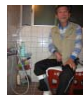
清酒箱に腰掛ける