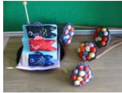
玄関で泳いでた「こいのぼり」

有料職業紹介 つしま紹介所 (0567)26-1281 訪問介護 ナイス・ケア (0567)26-3699 通所介護 ナイス・デイ (0567)26-1282 宅老 & 託児 ナイス・ホーム (0567)26-1282 E-mail s_o_s@clovernet.ne.jp (有)サポート・ワン・サービス 〒496-0036 愛知県津島市愛宕町4-113 代表TEL:0567-26-3921/FAX:0567-26-3922