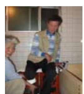
さあ、片足ずつ・・・