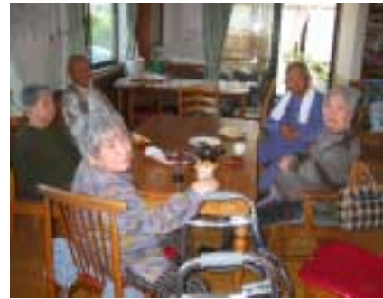
3時のおやつに柏餅。「おいしかったね☆☆」