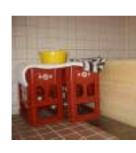
ちょうど良い高さの