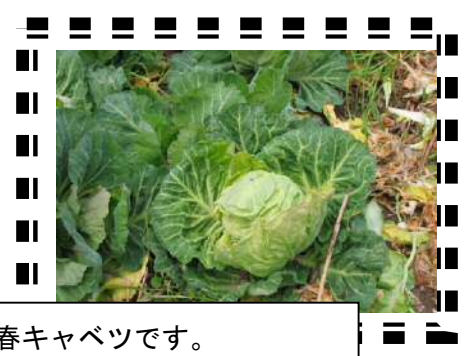
春キャベツです。 後もう少しで食べ頃かな?