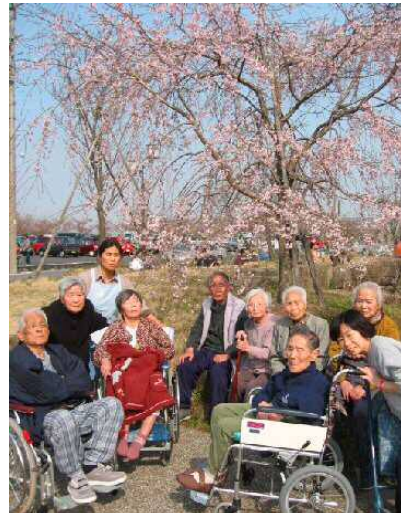
平成15年4月3日 津島市天王川公園にて